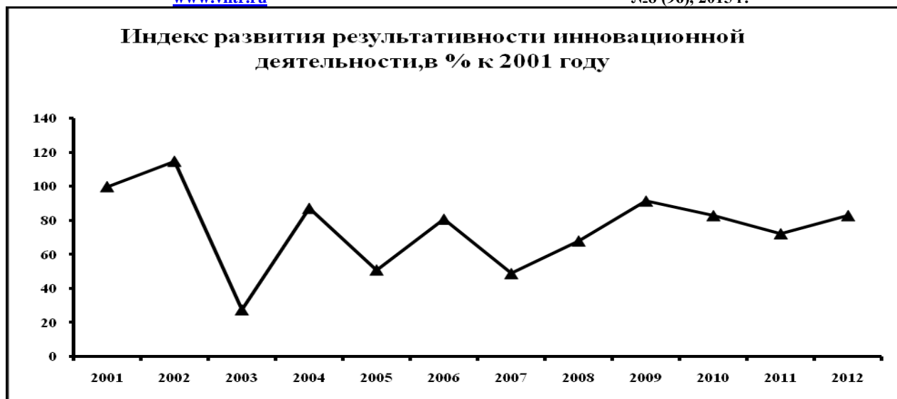
Рис. 3 - Индекс развития результативности инновационной деятельности в Республике Карелия, в % к 2001 году

Одной из задач Правительства Республики Карелия является помощь в продвижении выпускаемой инновационной продукции карельских предприятий на внешние рынки.